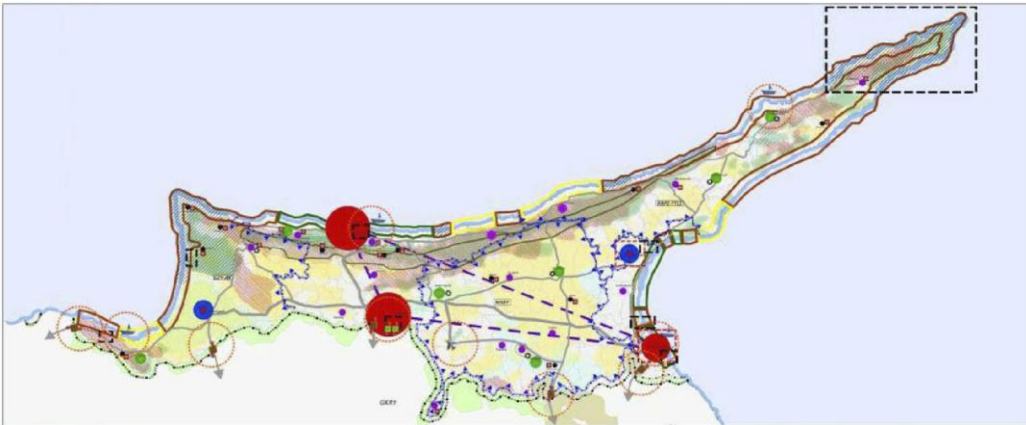
Ülkesel Fizik Planı Taslağı, Ana Mekansal Gelişim Strateji Şeması